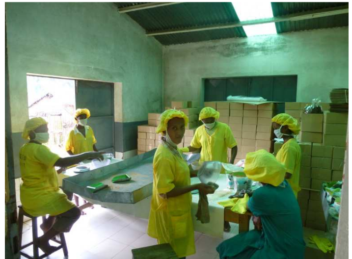
L'équipe de conditionnement