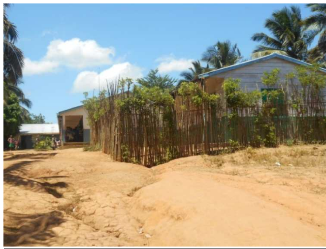
L'EPP de Fanandrana (25km de Tamatave)

« A Fanandrana, il y a dans notre école 14 enseignants pour 570 élèves. Nous connaissons bien la coopérative PAACO car elle participe au fonctionnement de l'EPP.