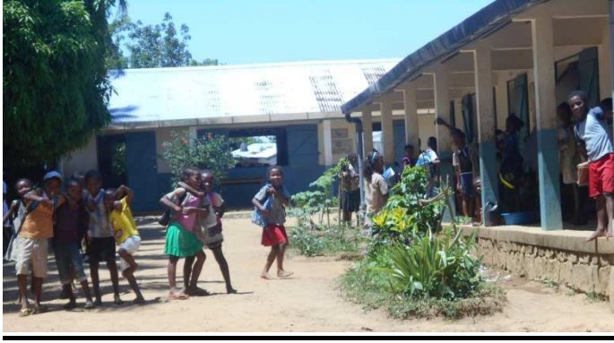
Les écoliers dans la cour de récréation

nettement supérieur aux autres enfants. Vraiment, je pense que cette coopérative est bénéfique pour le village et ses villageois.