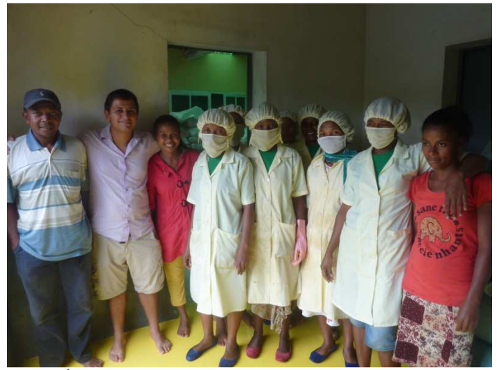
Les ouvrières de conditionnement du sucre

A partir de la canne à sucre cultivée par les agriculteurs locaux et coopérateurs, plus de 32 tonnes de sucre (certifiées Bio et équitable) ont été produites en 2015, dont 29 tonnes exportées en France (on peut le trouver dans certaines grandes surfaces) et en Suisse. Trois tonnes ont été vendues localement, à Madagascar. Des contrats cadres ont été signés avec deux grands partenaires commerciaux, à savoir Ethiquable et Pronatec. Grâce à ces accords privilégiés, il nous est possible d'envisager un potentiel de 100 tonnes de sucre commercialisable dès 2016. C'est pourquoi, ManaoDE CE envisage dès maintenant d'agrandir la sucrerie pour répondre à cette demande accrue et prometteuse.