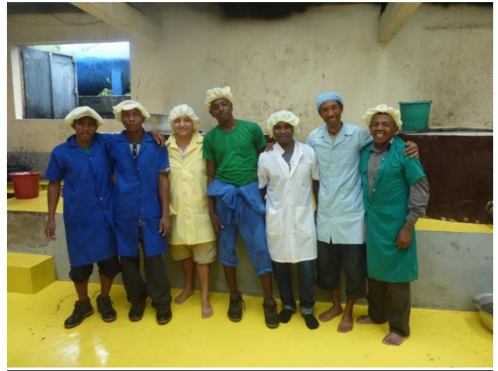
L'équipe de cuiseurs/ batteurs du sucre