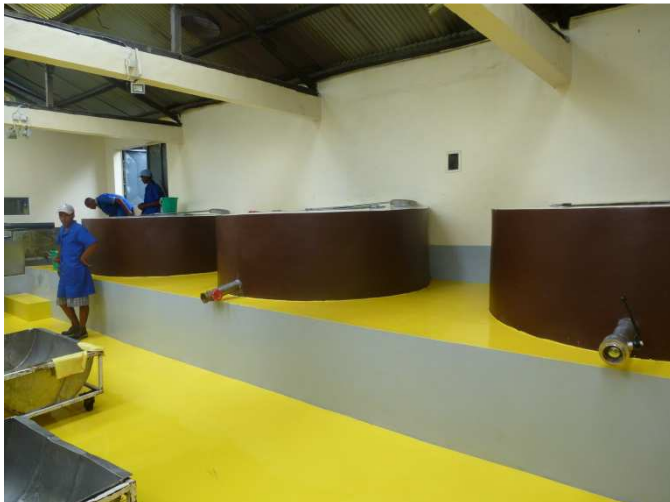
La salle de cuisson du jus de canne à sucre

A partir de la canne à sucre cultivée par les agriculteurs locaux et coopérateurs, plus de 32 tonnes de sucre (certifiées Bio et équitable) ont été produites en 2015, dont 29 tonnes exportées en France (on peut le trouver dans certaines grandes surfaces) et en Suisse. Trois tonnes ont été vendues localement, à Madagascar. Des contrats cadres ont été signés avec deux grands partenaires commerciaux, à savoir Ethiquable et Pronatec. Grâce à ces accords privilégiés, il nous est possible d'envisager un potentiel de 100 tonnes de sucre commercialisable dès 2016. C'est pourquoi, ManaoDE CE envisage dès maintenant d'agrandir la sucrerie pour répondre à cette demande accrue et prometteuse.