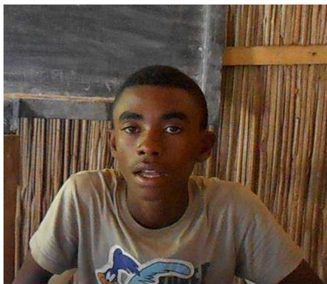
Elève de seconde au lycée

Nous aimerions si c'est possible aller encore plus loin afin de donner accès à tous les enfants de la commune au sport. Nous aimerions que ManaoDE CE nous aide à mettre en place un club de sport. Aujourd'hui pour être honnête nous remercions ManaoDE CE car sans eux nous ne serions pas là où nous en sommes. Enfin, pour le futur nous espérons continuer encore longtemps ce partenariat avec l'association ManaoDE CE. »