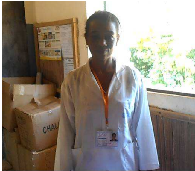
Directrice de l'École Primaire Publique (EPP) de Fanandrana