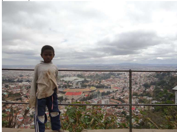
Un enfant des rues sur les hauteurs de Tananarive

(La CIDE est un traité international adopté par l'Assemblée Générale des Nations Unies, le 20 novembre 1989 et dont ManaoDE fait la promotion.)