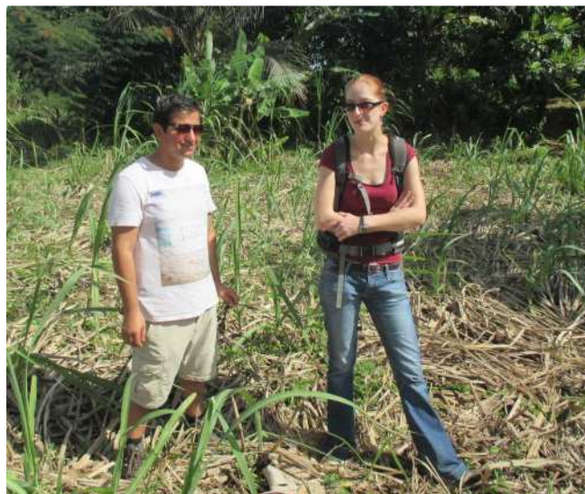
Les deux coordinateurs projets sur les parcelles de canne à sucre

Leurs objectifs : assurer le bon fonctionnement de la coopérative à Tamatave, trouver de nouveaux débouchés commerciaux... tout en s'assurant que cela contribue à la scolarisation des enfants des producteurs de ManaoDE CE.