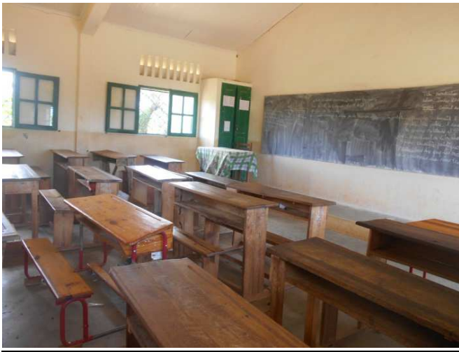
Salle de classe à l'EPP

Pour continuer l'aide que nous apporte PAACO nous aimerions qu'il clôture l'école et surtout le château d'eau car, nous avons du mal à le protéger. En effet l'eau potable pour les enfants scolarisés est une priorité ; il faudrait donc fermer ce château d'eau afin que personne d'autre que les écoliers ne puissent s'en servir.