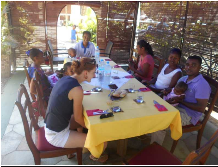
Toute l'équipe ManaoDE et leur famille réunie